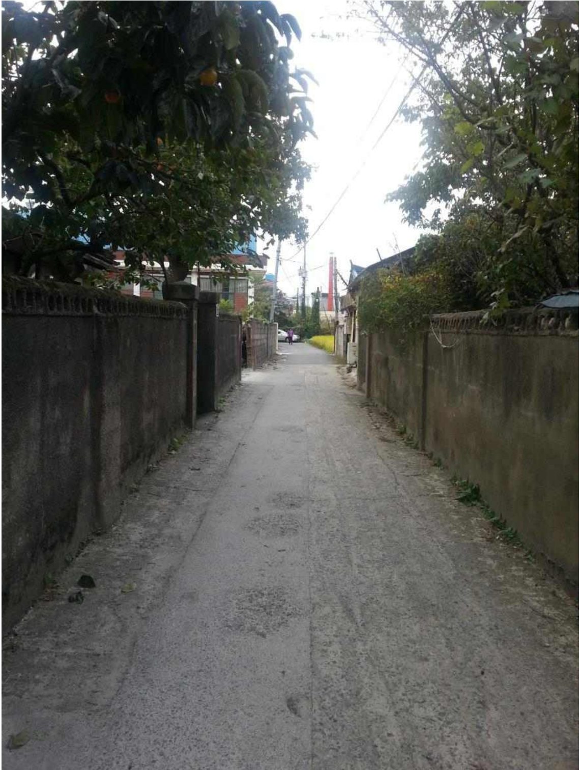
사진5. 성내의 오래된 마을_1