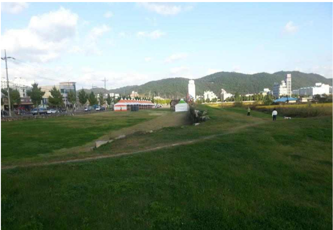
사진1. 읍성 북서측에서 동측조망