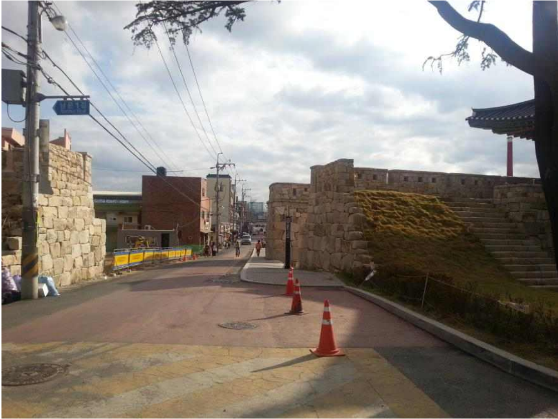
사진14. 남측 진입마당 (성내에서 성외부를 조망)