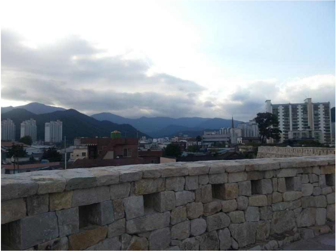
사진12. 웅성에서 읍성 남서측을 조망