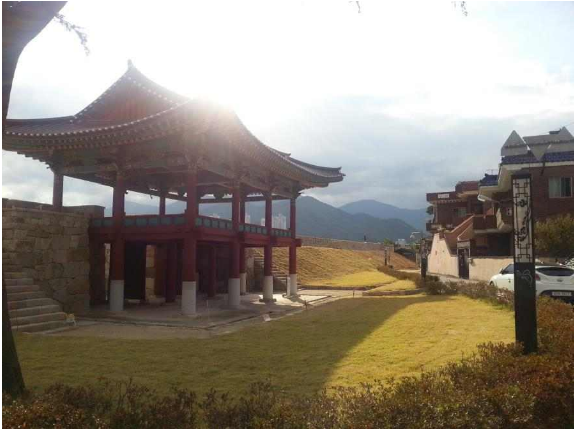
사진10. 읍성 남측 영화루 (성내)