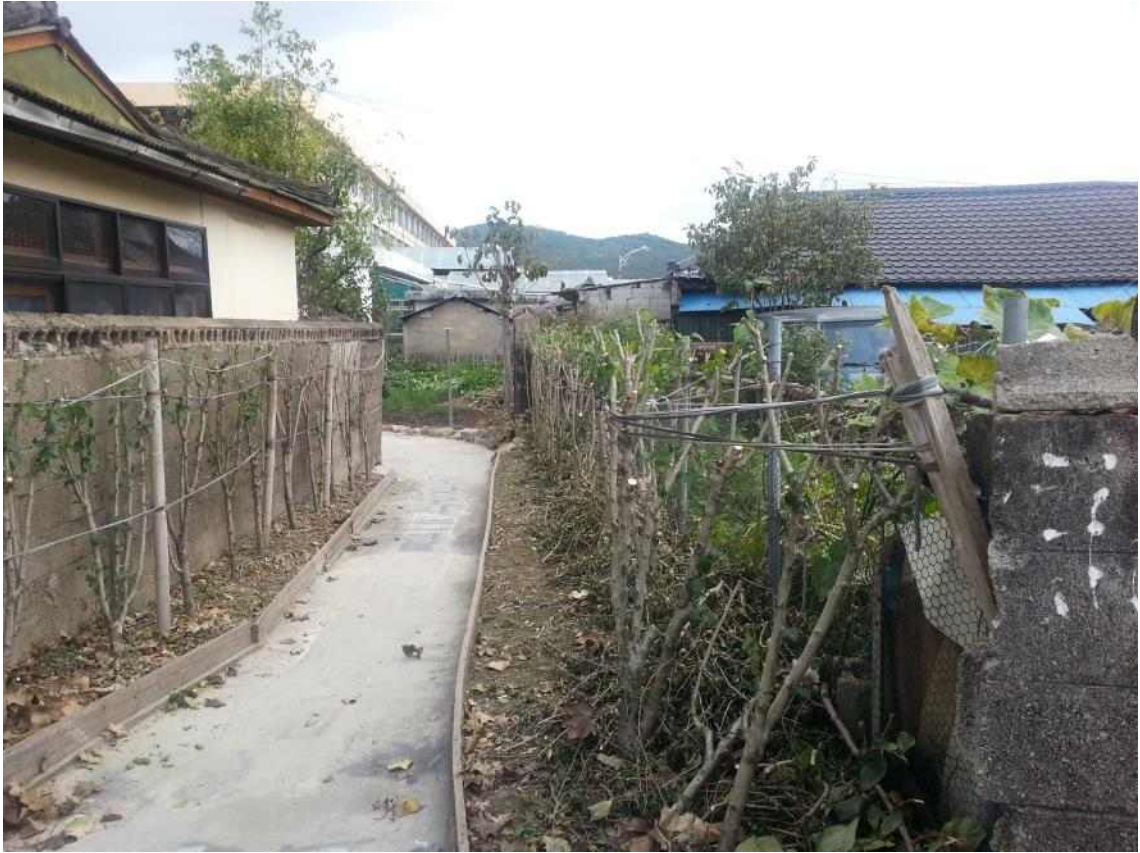
사진6. 성내의 오래된 마을_2