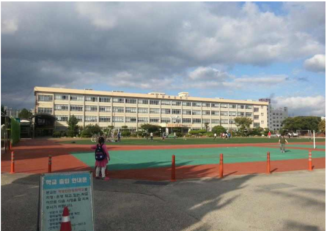
사진7. 성내 연양초등학교