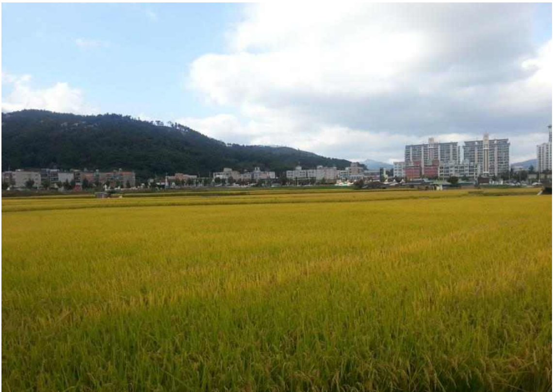
사진9. 성내 사유지 경작 현황_2