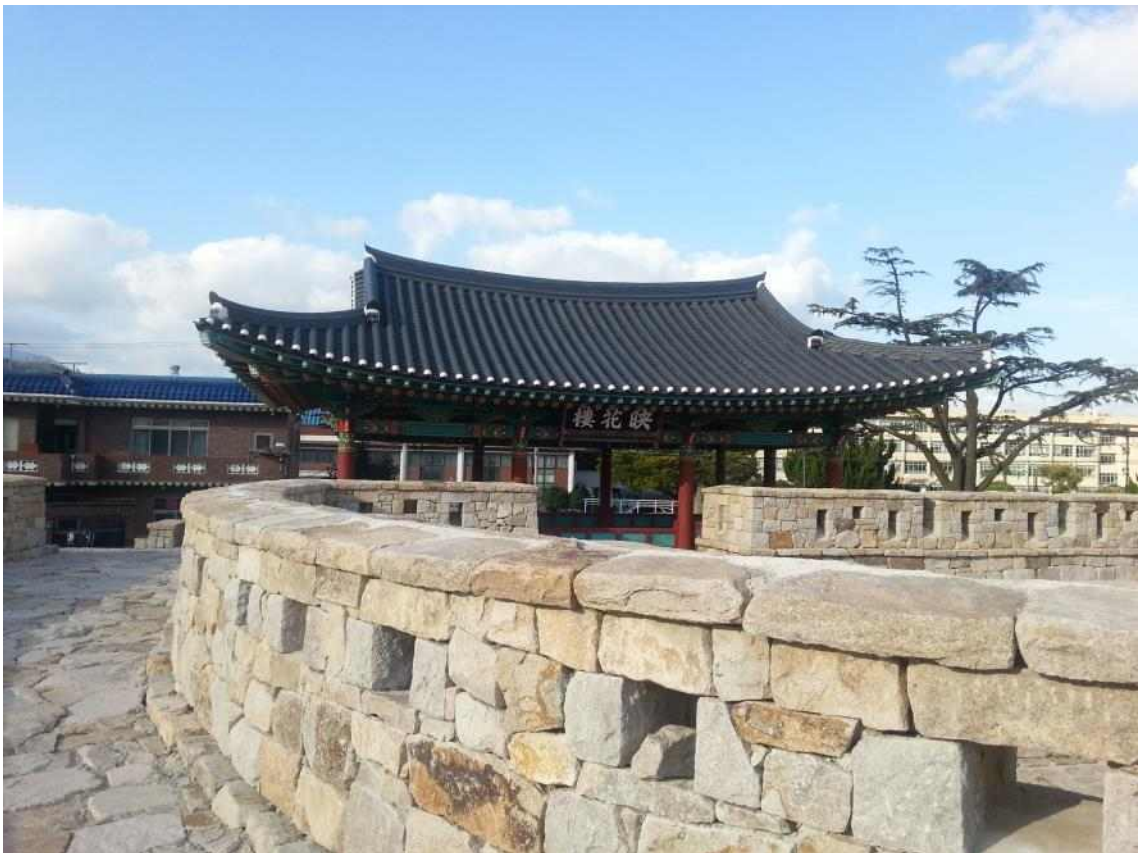
사진11. 영화루와 읍성