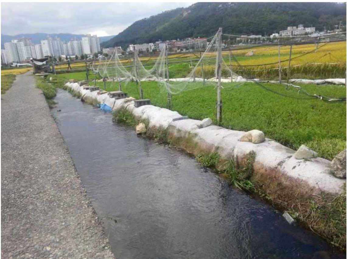
사진4. 성내를 가로지르는 맑고 풍부한 수계(언양읍성 내부를 수평으로 가로지름)