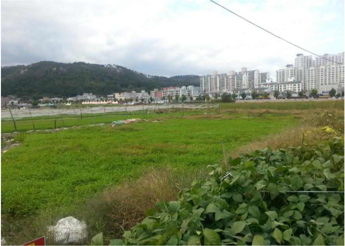
사진8. 성내 사유지 경작 현황_1