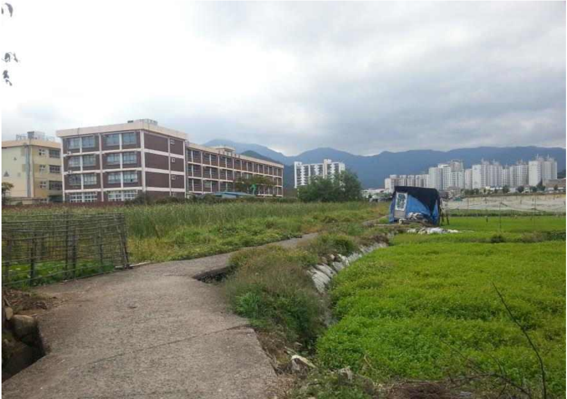
사진3. 성내의 옛길(좌측_초등학교, 멀리 성외 아파트단지조망)