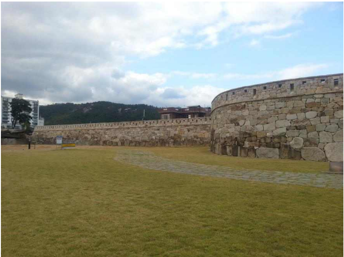
사진13. 읍성 남측 웅성