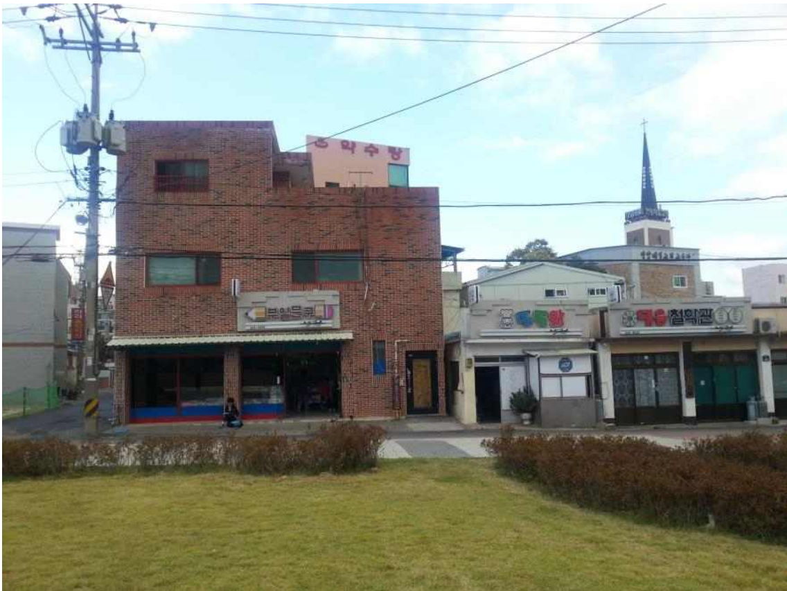
사진15. 남측 읍성 주변 건물