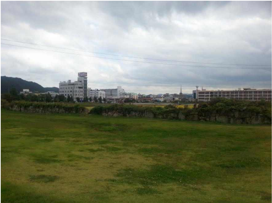
사진1. 읍성 북측에서 남측조망