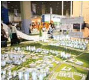
Korea Architecture Fair & Festival 2013